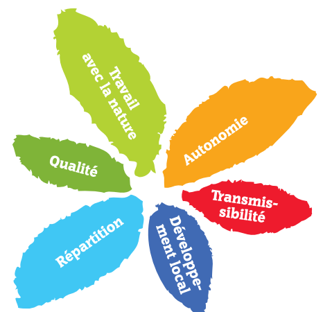
Les 6 thèmes structurants du diagnostic d'analyse des fermes au regard du projet d'agriculture paysanne.

* Pour soutenir politiquement l'agriculture paysanne , construire collectivement l'avenir, faire vivre ce projet politique, adhérer et s'engager à la Confédération paysanne de son département.